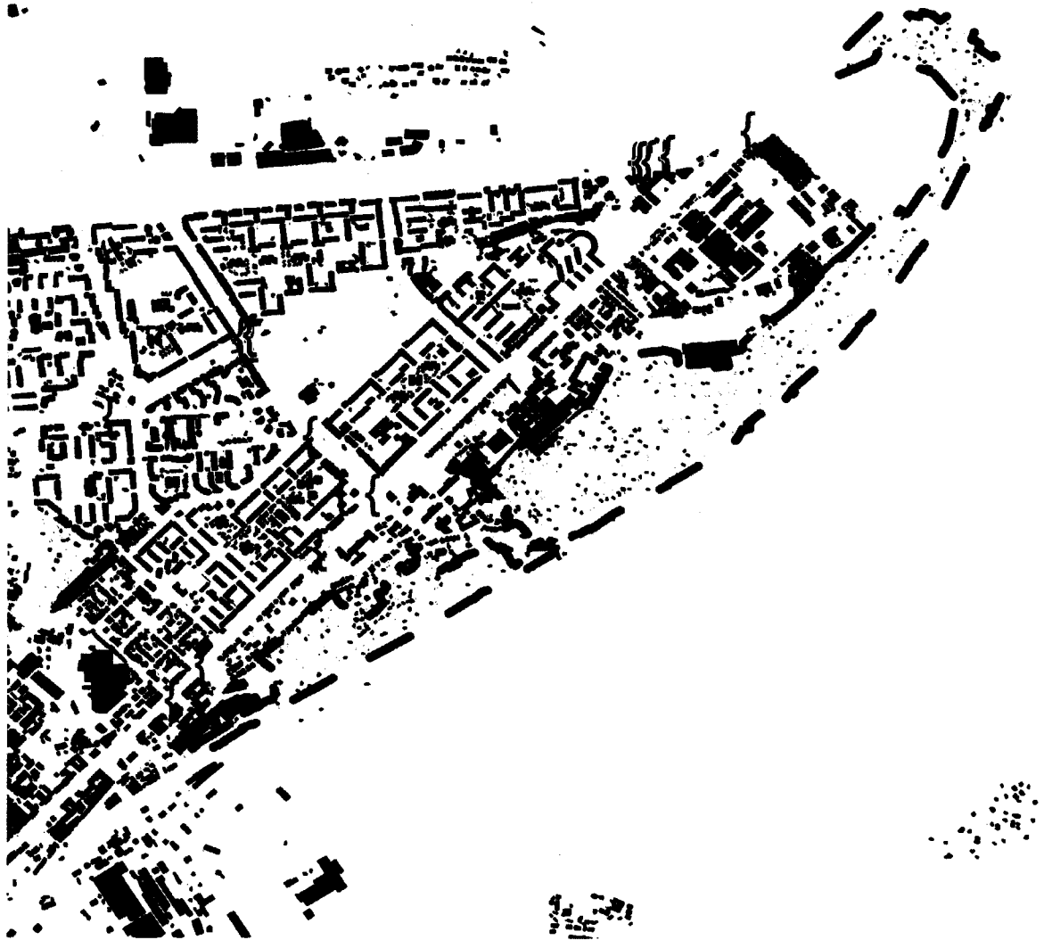
СХЕМА границ территории для проведения общественных обсуждений

Приложение к постановлению главы города от 11.06.2024 № 31