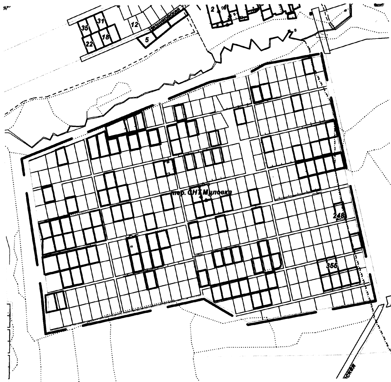
СХЕМА границ территории для проведения общественных обсуждений

Приложение к постановлению главы города от 02.04.2024 № 18