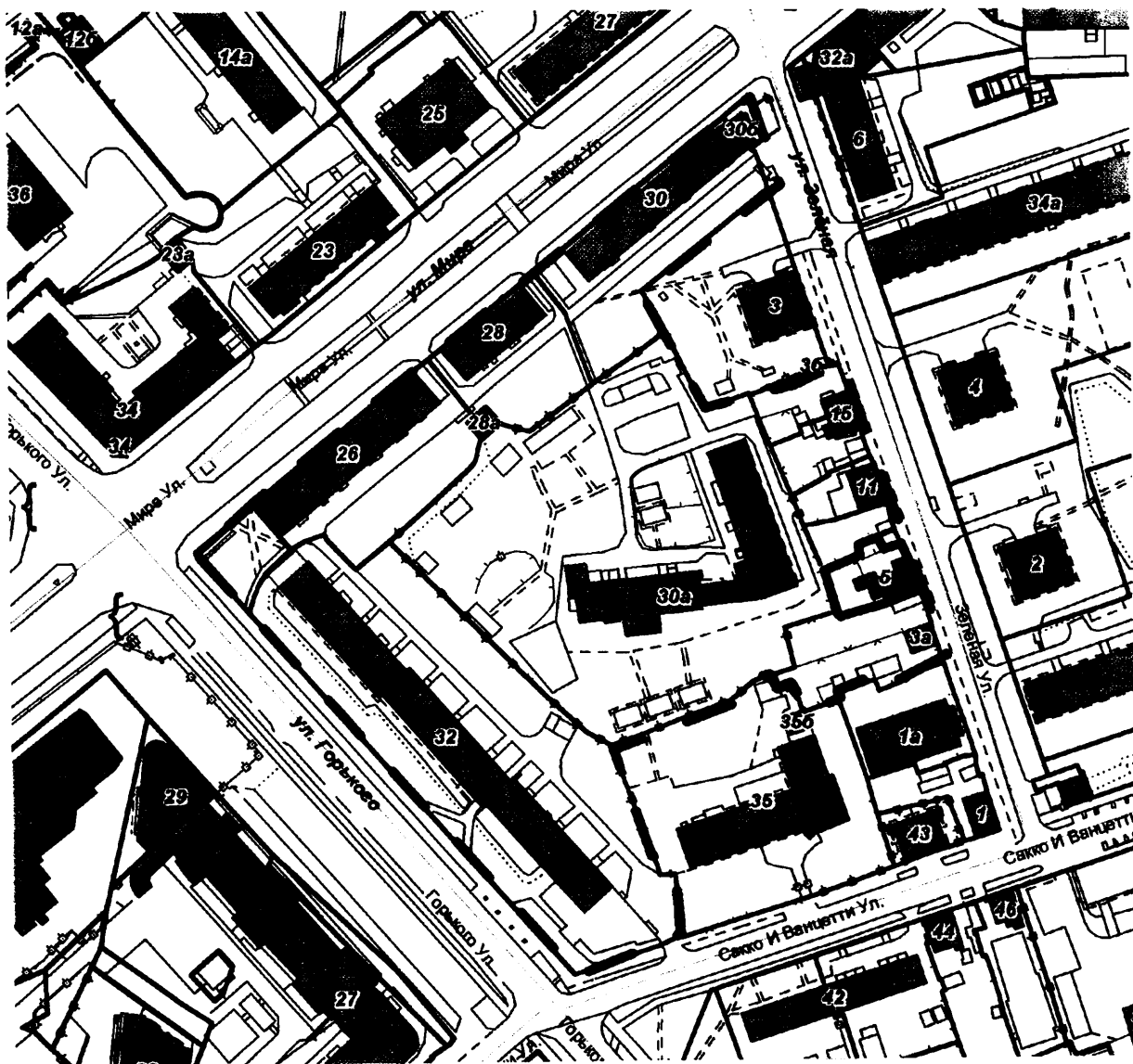
СХЕМА границ территории для проведения общественных обсуждений

Приложение к постановлению главы города от 02.04.2024 № 19