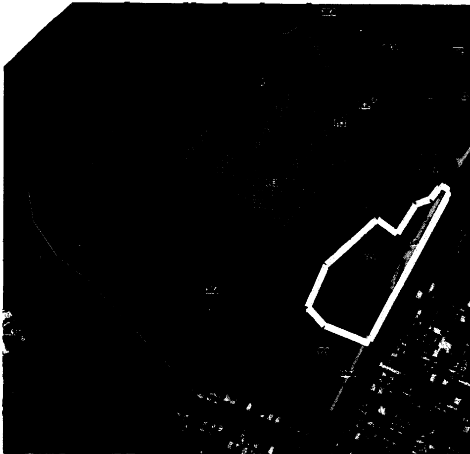
СХЕМА границ территории проектирования

Приложение № 1 к постановлению администрации города Владимира от 02.11.2024 № 2459